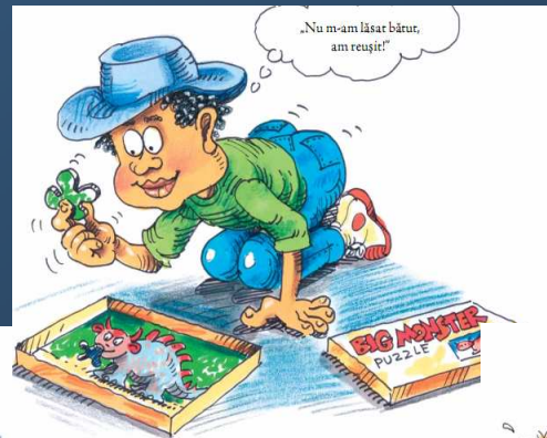
Petre cel Perseverent