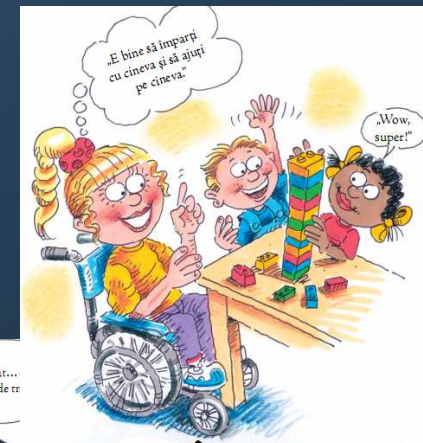
Ina cea Întelegătoare