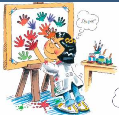
Ioana cea Încrezătoare