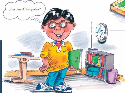
Ovi cel Organizat